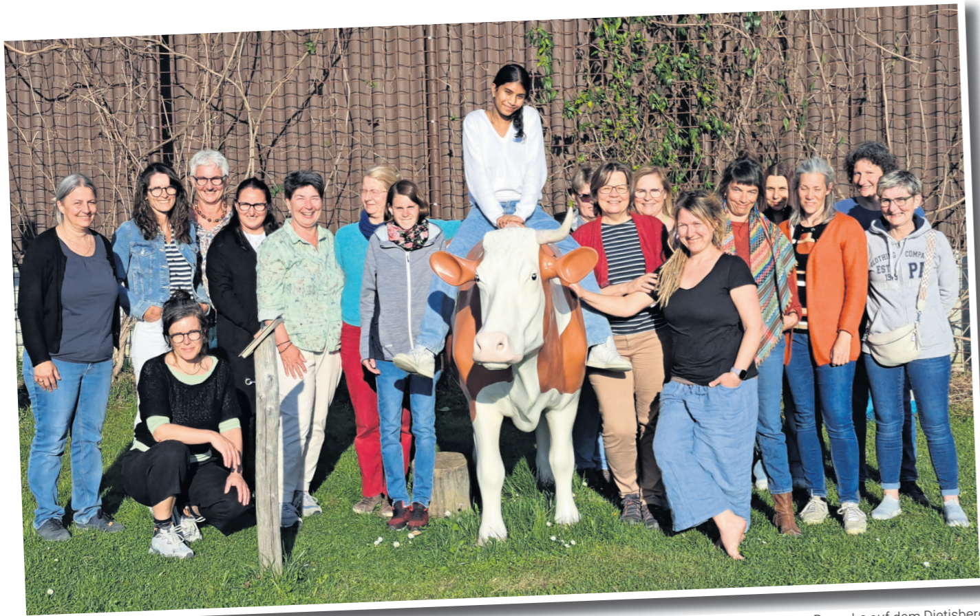
Das aufgestellte SpiteX-Team anlässlich eines Besuchs auf dem Dietisberg