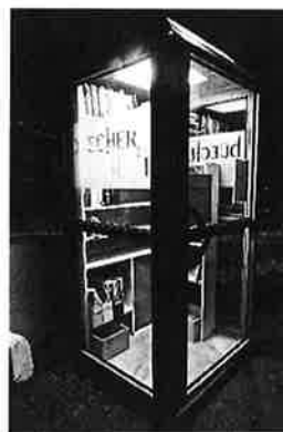
... und bei Nacht!