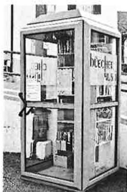
Offen bei Tag ...